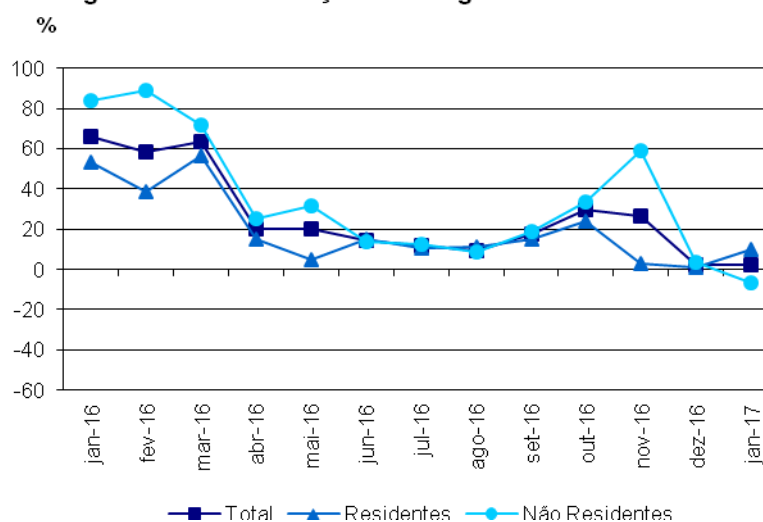
Figura 1. Taxa de variação homóloga mensal das dormidas

As dormidas dos residentes em Portugal aumentaram no mês de janeiro 10,0% relativamente ao mês homólogo. As dormidas dos residentes no estrangeiro registaram uma diminuição de 6,7%. No país, em janeiro, as dormidas registaram um aumento em termos homólogos de 12,6%.